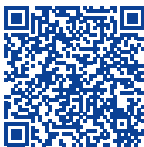
Anleitung zum Handling von Säuglingen

Weitere Informationen erhalten Sie auf www.mvb-be.ch/de oder telefonisch unter 031 552 17 17 (Montag bis Freitag von 9 bis 13 Uhr).