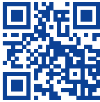
Mütter- und Väterberatung

Auch nach Ihrer Entlassung aus dem Spital sind wir bei Bedarf weiterhin für Sie da. Sie können zudem von zahlreichen Angeboten profitieren: